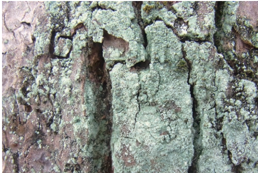
図3. クスの樹幹上に生育するミナミレブラゴケモドキ. Fig. 3. Lepraria leuckertiana growing on trunk of Cinnamomum camphora .