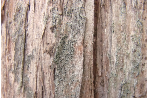
図1. 針葉樹の樹幹上に生育するヒメスミイボゴケ. Fig. 1. Amandinea punctata growing on trunk of a coniferous tree.