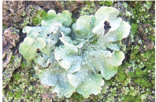
図4. 常緑広葉樹の樹幹上に生育するハクテンゴケ. Fig. 4. Punctelia borrieri growing on trunk of an evergreen hardwood.

日本新産の2種以外の14種はいずれも南方系の地衣類で、西南日本で普通に見られる種であった。そこで、長居公園と環境のよく似た地域に生育する地衣類の種類を比較することで長居公園に特有の現象、あるいはそれらに共通する地衣類を明らかにしたいと考えた。長居公園と類似した大都市部の緑地帯に生育する地衣類については今まで東京都皇居 (Kashiwadani et al. , 2000; Ohmura et al. , 2014) と福岡市西公園 (川上他, 2012b) が報告されている。長居公園で確認された地衣類とそれらで確認された地衣類を照合するとそれぞれ5種あるいは7種が共通で、三つの地域に共通する地衣類はナミムカデゴケ、ムカデゴゴケ、ロウソクゴケの3種であった。これら3種は都市公園の環境によく適応した種と考えられる。皇居や福岡西公園と異なり、長居公園では石垣や露岩上に生育する地衣類が確認できなかった。ただし、コンクリート上にはダイダイゴケ属が確認できたが、標本を採集することができなかったので、種の同定には至っていない。皇居ではウメノキゴケ科のような大形葉状地衣類が報告されていないのに比べ、長居公園では3種が確認された。これらのことは地衣類の生育環境が長居公園とそれら地域との間で異なることを示している。