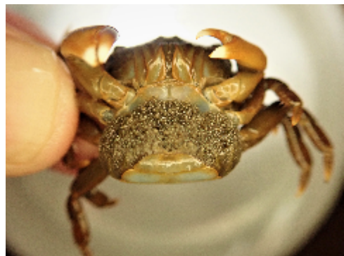
卵を抱えるヒライソガニのメス

メスは幼生がかえるまで、お腹に卵を抱える必要があります。ふんどしが広い理由がわかりますね。