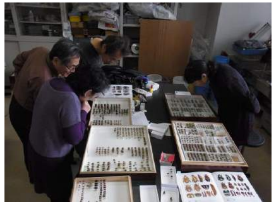
Fig. 7. Identification work indoors. March 10th, 2012. Osaka Museum of Natural History.