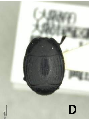
キノコエンマムシ (1957年) Margarinotus boleti