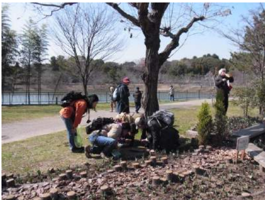
Fig. 6. Field survey with citizen scientists. Tsurumi Ryokuchi Green Park, March 14th, 2012.