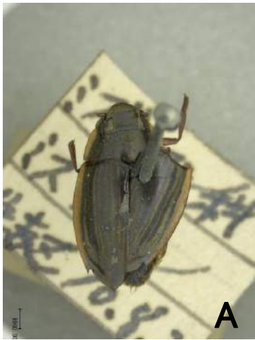
オオミズスマシ (1935年) Dineuthus orientalis