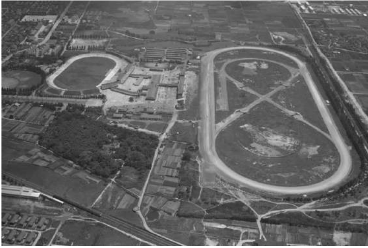
Fig. 4 An aerial photo of Nagai in 1958 from the west to the east. Many young entomologists used to go to the deep forest around Rinnan-ji Temple.

図4. 長居公園予定地の航空写真(1958年)。西から東を望む。昆虫少年の多くは臨南寺の深い森へ通った。