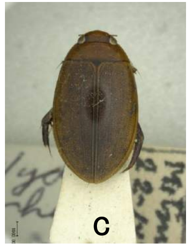
ウスイロシマゲンゴロウ (1958年) Hydaticus rhantoides