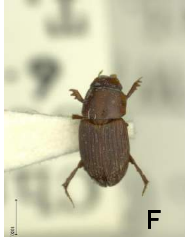
コスジマグソコガネ (1959年) Aphodius lewisi