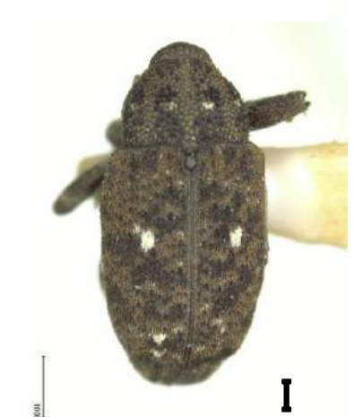
ニセマツノシラホシゾウムシ (1956年) Shirahoshizo rufescens