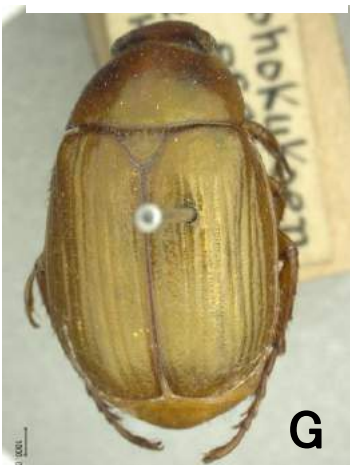
ヒメサクラコガネ (1955年) Anomala geniculata