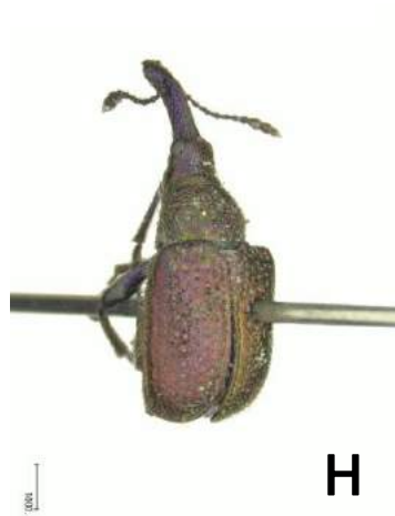
モモチョッキリ (1951年) Rhynchites heros