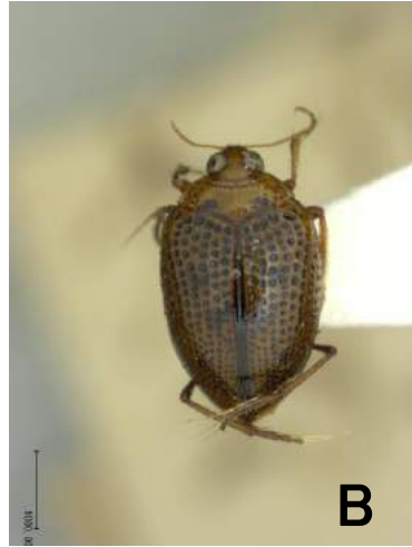
コガシラミズムシ (1936年) Peltodytes intermedius