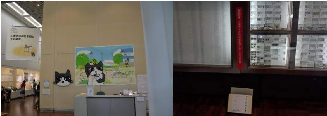
Fig. 5. Special Exhibition "Urban Nature" at the Osaka Museum of Natural History in 2014. Beetle specimens of Osaka City (right).

図4. 長居公園予定地の航空写真(1958年)。西から東を望む。昆虫少年の多くは臨南寺の深い森へ通った。大阪歴史博物館所蔵。