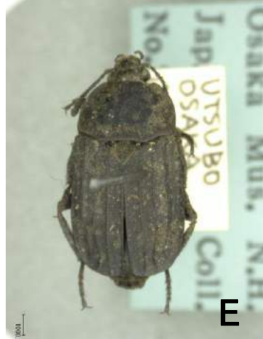
ヒメヒラタシデムシ (1958年) Thanatophilus sinuatus