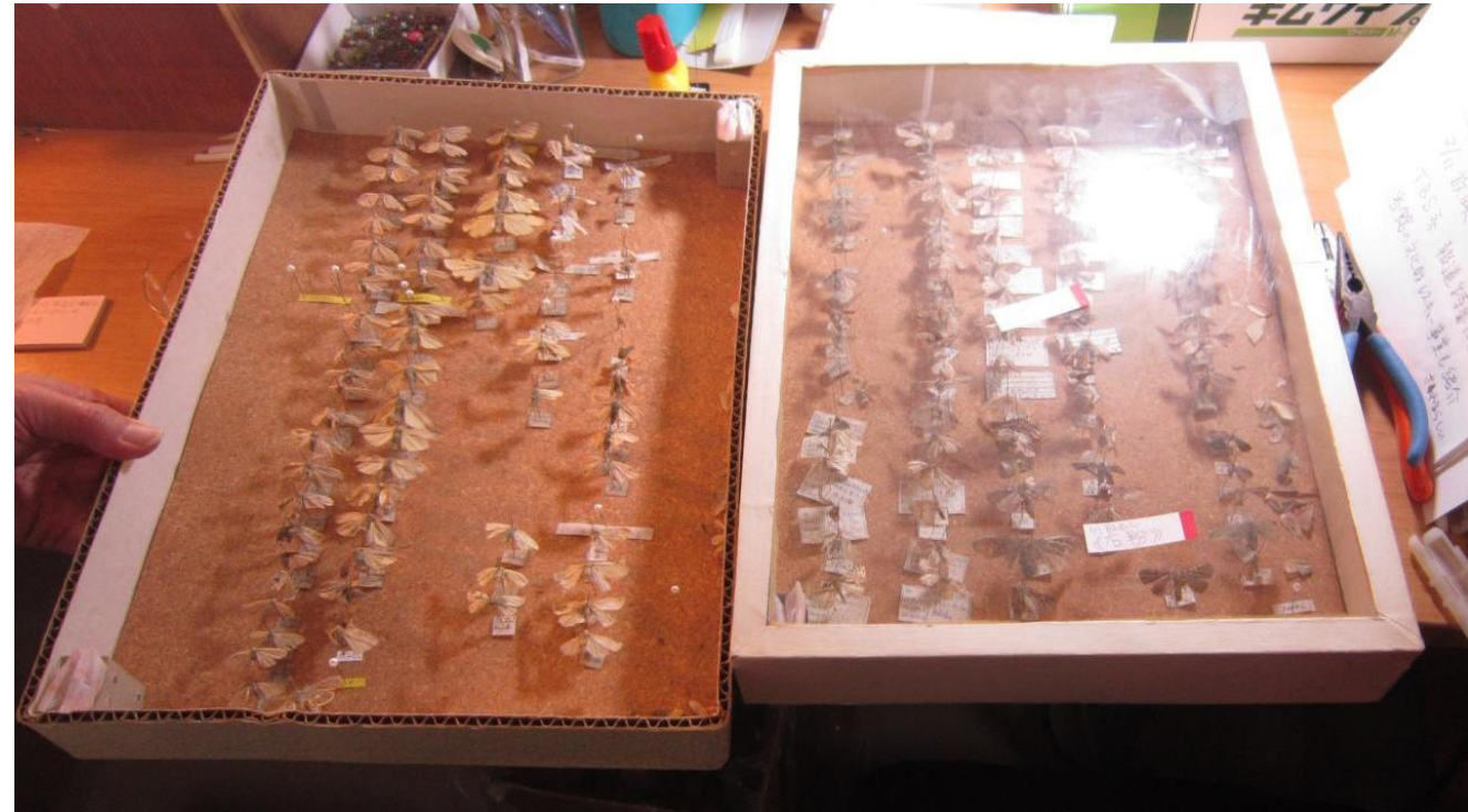
▲クリーニング終了後の標本を新しい箱に詰め替えたところ