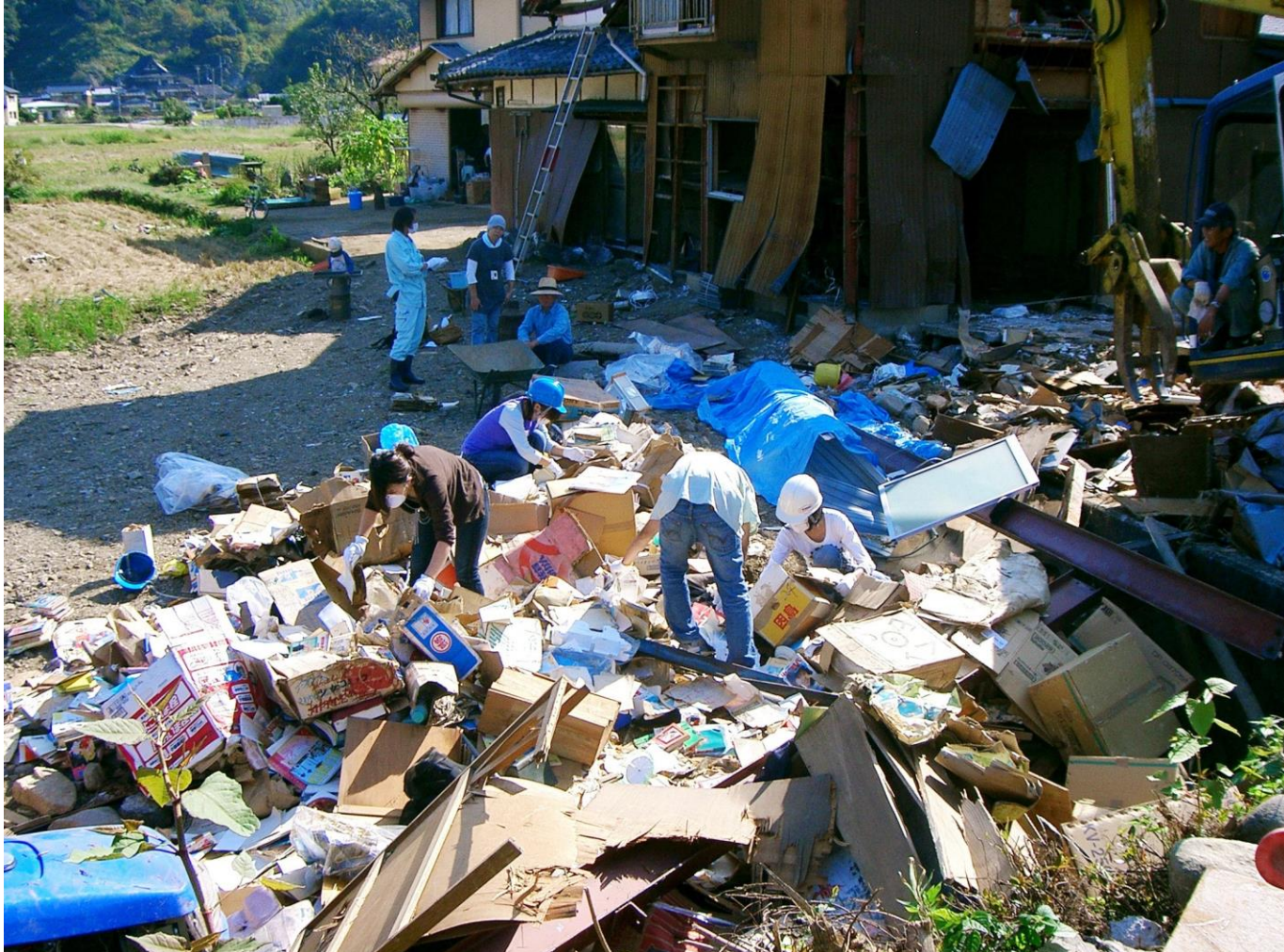
▲2009年台風9号による被災地レスキュー（兵庫県佐用町）現場

今度レスキューに行きますから…と約束していたにもかかわらず、予定よりも解体が早まったとのことで、現場に急行してみれば、ユンボにより建物が解体された後だった。