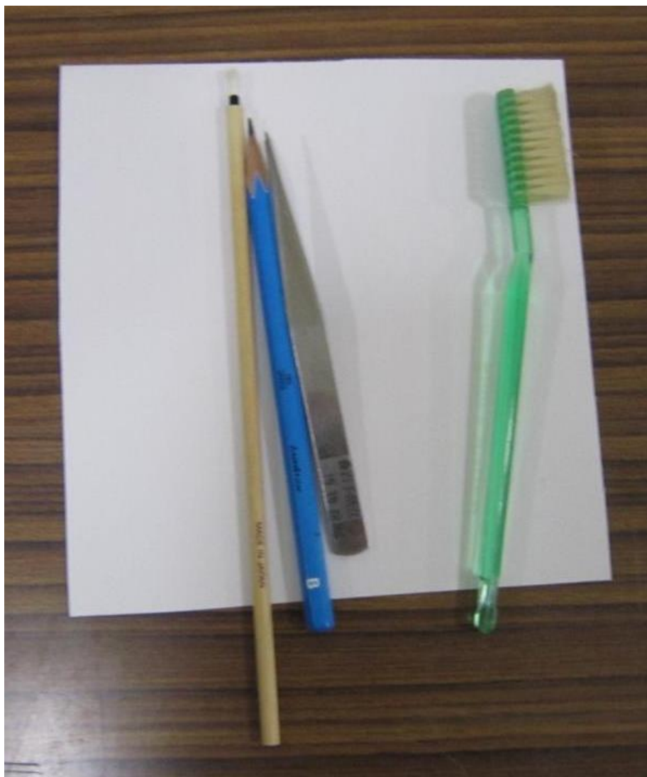
▲標本クリーニングで使用している道具。 歯ブラシ、小筆、鉛筆、ピンセット