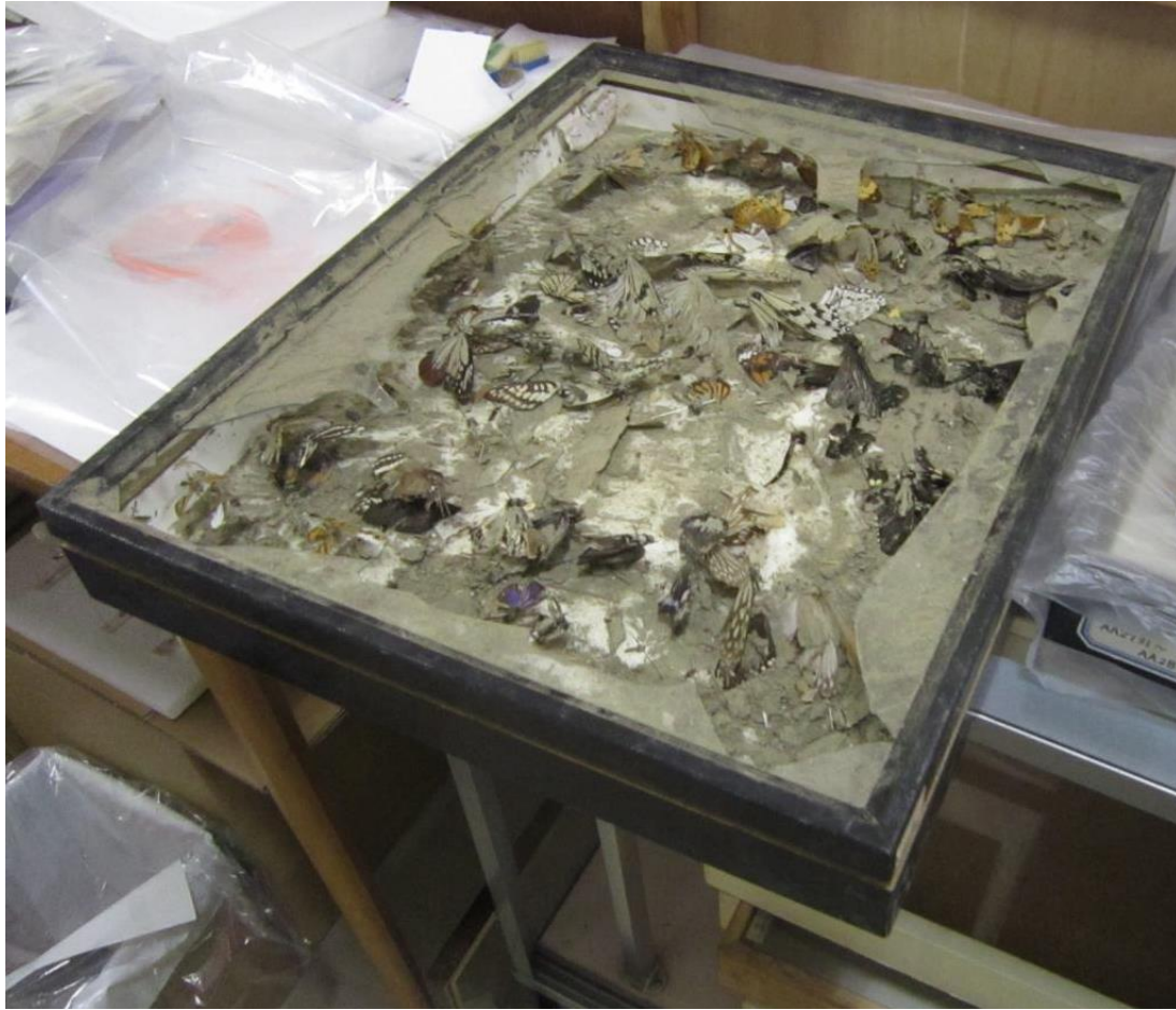
▲津波被害に遭った標本資料。ガラスも割れ、蝶の標本も砂をかぶってしまった。