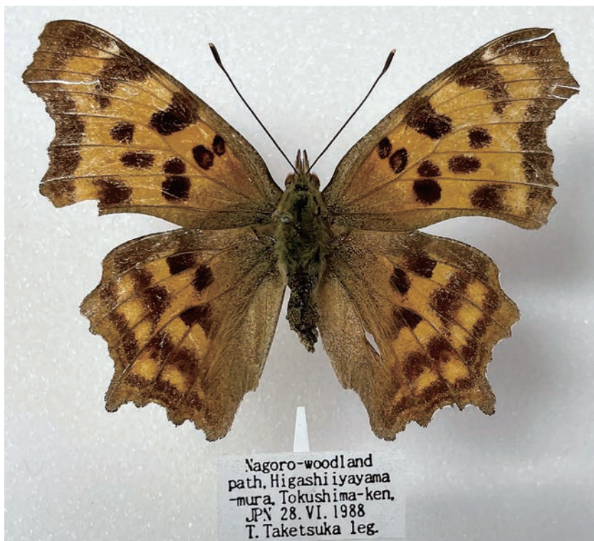
図13. シータテハ (徳島県西祖谷山村名頃 1988年6月28日採集)