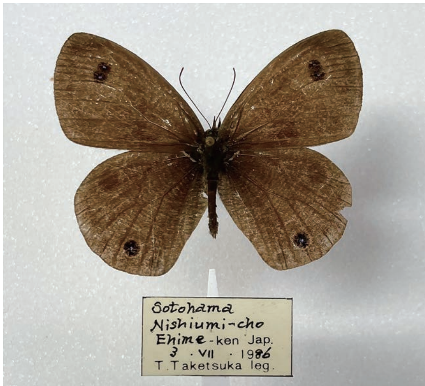
図16. ウラナミジャノメ (愛媛県西海町外浜 1986年8月3日採集)