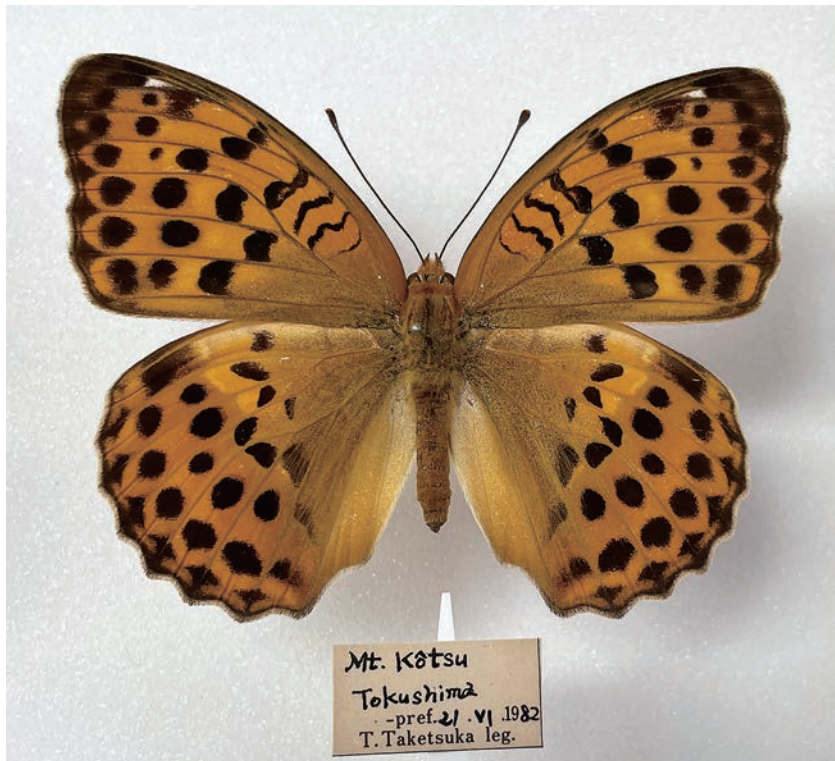
図11. ウラギンスジヒョウモン (徳島県高越山 1982年6月21日採集)