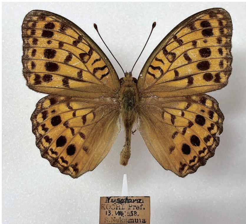
図12. オオウラギンヒョウモン (高知県禰原町 1958年8月13日採集)