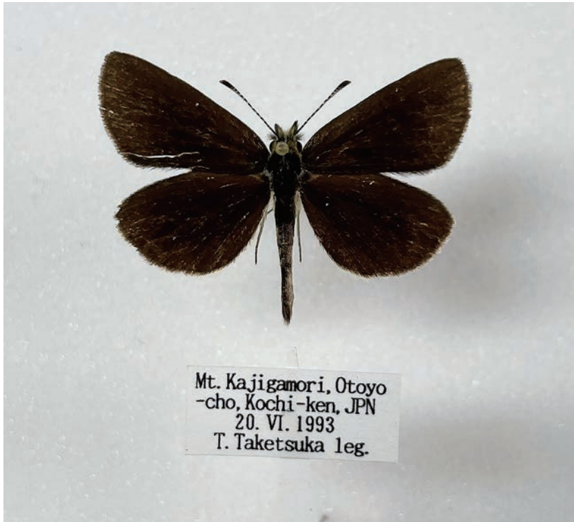
図5. ギンイチモンジセセリ (高知県大豊町梶ヶ森 1993年6月20日採集)