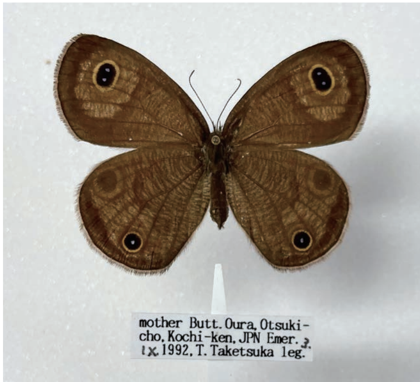
図17. ウラナミジャノメ (高知県大月町大浦 1992年9月3日羽化)