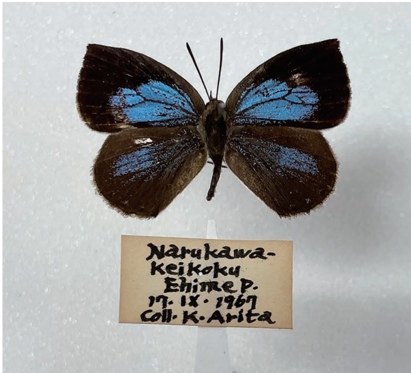
図6. ルームスシジミ (愛媛県成川溪谷 1967年9月17日採集)