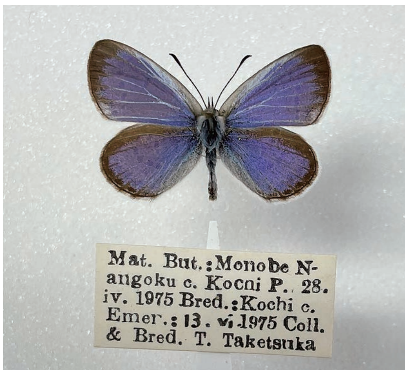
図10. シルビアシジミ (高知県南国市物部 1975年6月13日羽化)