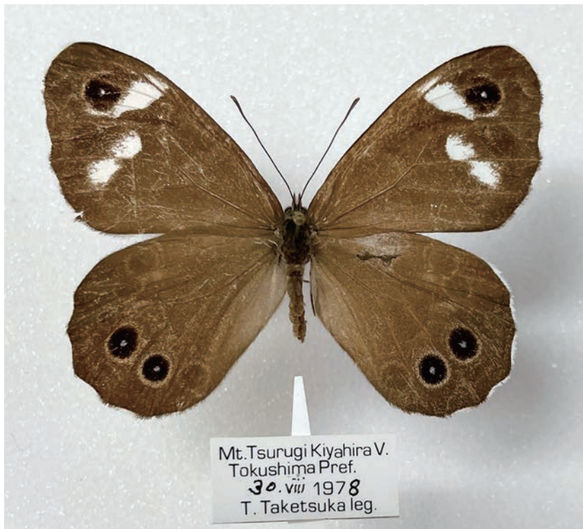
図18. ツマジロウラジャノメ (徳島県木屋平村剣山 1978年8月30日採集)