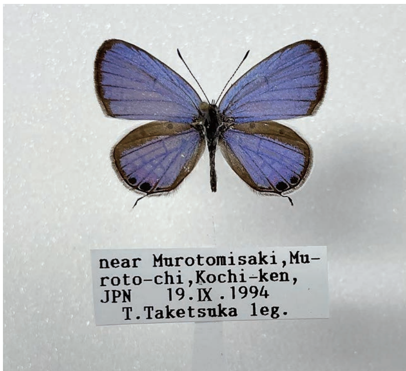
図9. タイワンツバメシジミ (高知県室戸市室戸岬 1994年9月19日採集)