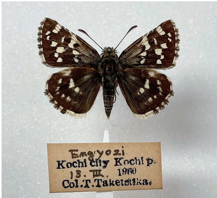
図3. チャマダラセセリ (高知県高知市円行寺 1960年3月13日採集)