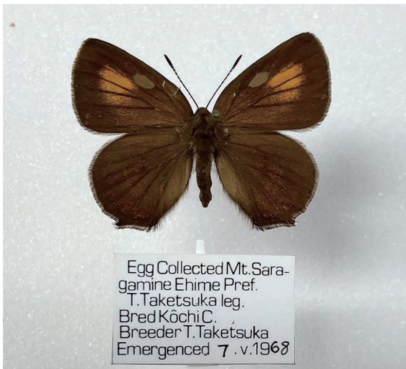
図7. ルーミスシジミ (高知県窪川町森ヶ内 1961年7月16日採集)

Egg Collected Mt. Saragamine Ehime Pref. T. Taketsuka leg. Bred Kôchi C. Breeder T. Taketsuka Emergenced 7. v. 1968