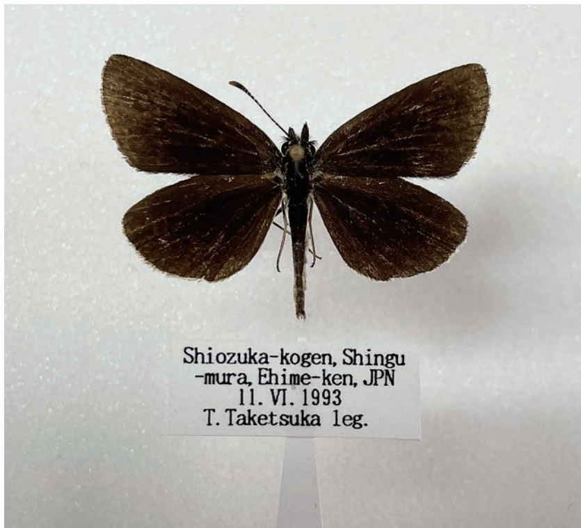
図4. ギンイチモンジセセリ (愛媛県新宮村塩塚高原 1993年6月13日採集)