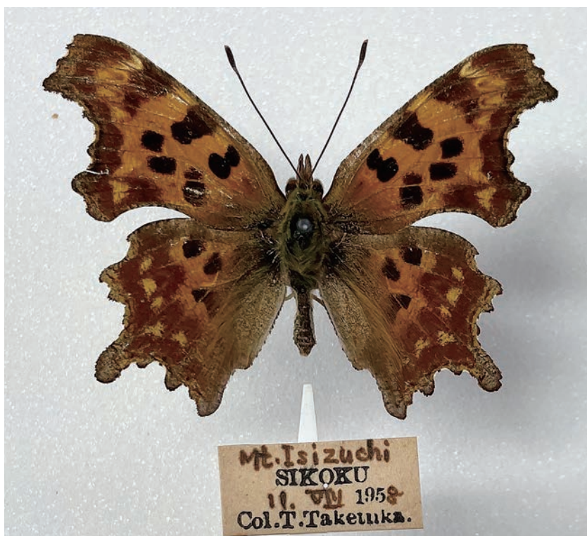
図14. シータテハ (愛媛県石鎚山 1958年8月11日採集)