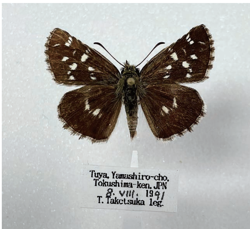
図2. チャマダラセセリ (徳島県山城町津屋 1991年8月8日採集)