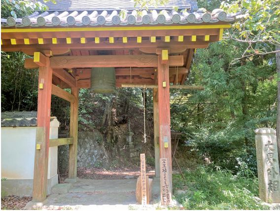
Fig. 1. The gate of the Kokiji temple. 図1. 高貴寺山門.