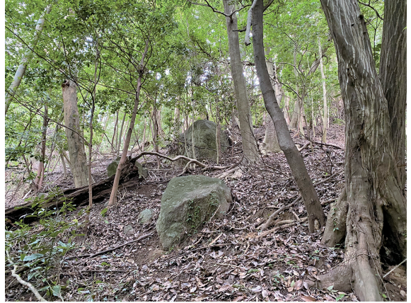
Fig. 2. The slope behind the upper building. Oaks, Quercus gilva , and huge rocks stand out. 図2. 奥之院の裏。イチイガシの巨木と巨岩が目立つ。