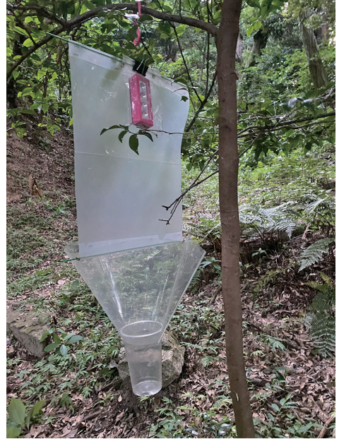
Fig. 5. A light FIT trap. 図5. ライトフィット.

期以前、神仏習合による一体的に運営がなされていたという。盤舟大神社、当山奥之院裏とも、巨岩が多く目立ち、自然崇拜による宗教的理由で森が古くから原始的状態で今日まで存続してきたと考えられる（図2）。