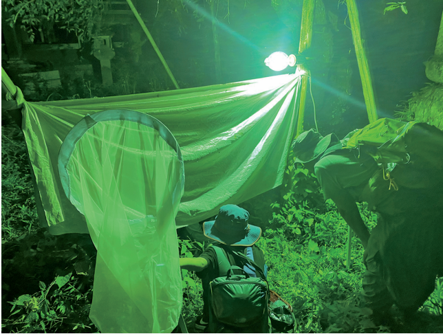
Fig. 4. A light trap using a mercury-vapor lamp. 図4. 水銀灯によるライトトラップ.